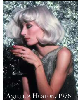
ANJELICA HUSTON, 1976