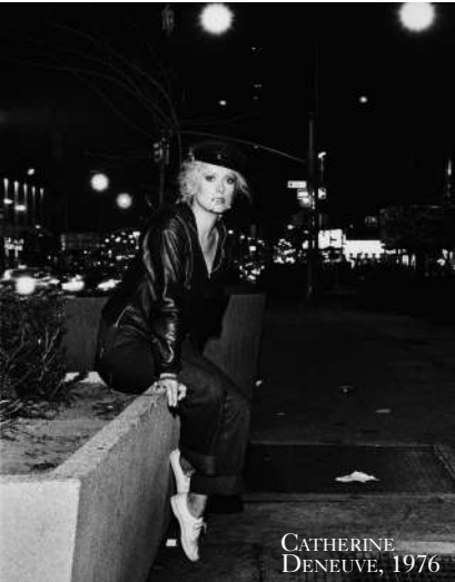
CATHERINE DENEUVE, 1976