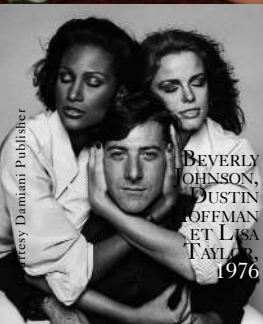
BEVERLY JOHNSON, DUSTIN HOFFMAN ET LISA TAYLOR, 1976