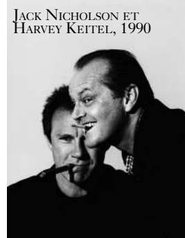
JACK NICHOLSON ET HARVEY KEITEL, 1990