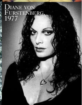
DIANE VON FURSTENBERG, 1977