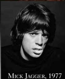
MICK JAGGER, 1977